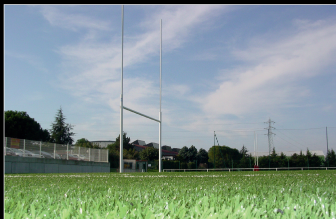
Stade Toulousain Rugby Club, Toulouse